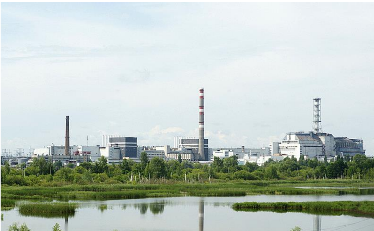
Kernkraftwerk Tschernobyl – 2009